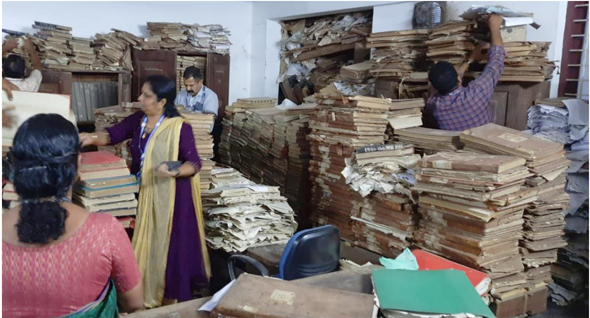
ഓപ്പറേഷൻ പബ്ലിസിറ്റി സംസ്ഥാനമൊട്ടാകെയുള്ള സബ് റെജിസ്ട്രാർ ഓഫീസുകളിൽ വിജിലൻസിന്റെ മിനൽ പരിശോധന