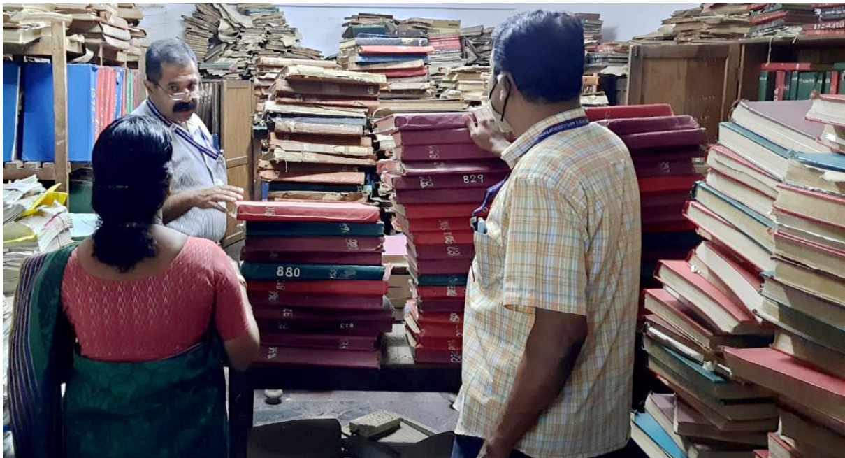
ഓപ്പറേഷൻ പബ്ലിസിറ്റി സംസ്ഥാനമൊട്ടാകെയുള്ള സബ് റെജിസ്ട്രാർ ഓഫീസുകളിൽ വിജിലൻസിന്റെ മിന്നൽ പരിശോധന